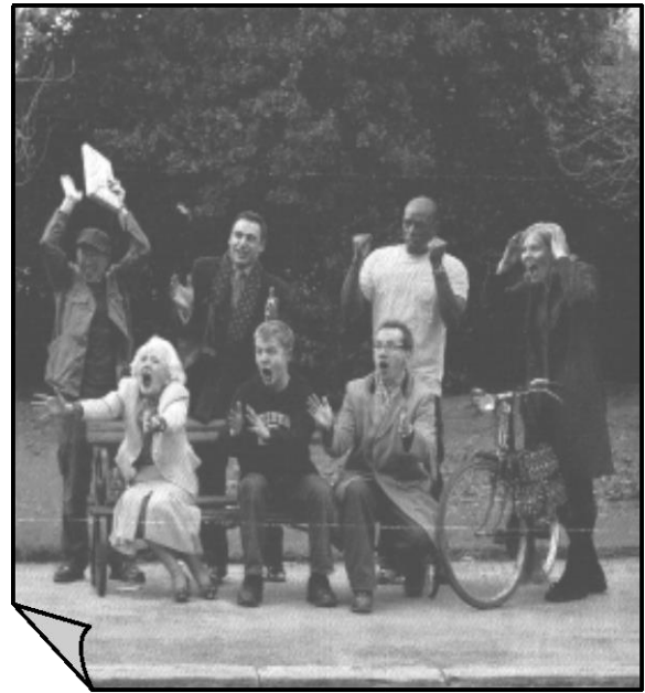
..Des adultes sur un banc..