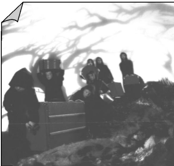
..Des enfants et des bagages..