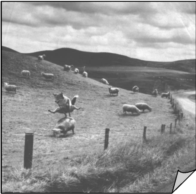
..Le loup et les moutons..