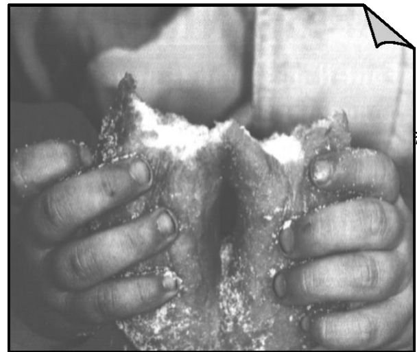
.. Des mains et un beignet..